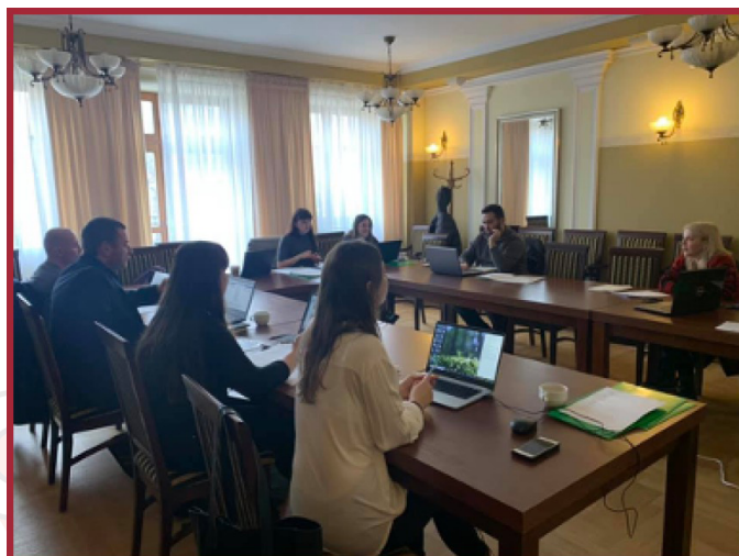
2. Międzynarodowe Spotkanie w Rzeszowie, Polska

Drugie międzynarodowe spotkanie w ramach projektu odbyło się w Rzeszowie, w Polsce w dniu 26 listopada 2020 roku. Było ono koordynowane przez Jugend-&Kulturprojekte. V., a gospodarzem był ACUMEN. Celem spotkania było monitorowanie postępów w realizacji projektu poprzez zbieranie od partnerów projektu i informacji o statusie zadań projektowych, przeglądanie ich na tle planu projektu oraz przegląd osiągniętych celów pośrednich i omówienie nadchodzących zadań dotyczących rozwoju IO2, IO3, IO4 i IO5.